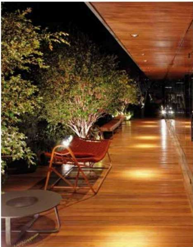
Acima, destaque para a iluminação do interior da Móvelia 22, com spots direcionáveis que possibilitam a criação de diferentes cenários sem provocar ofuscamento. Abaixo, o profissional ressaltou a beleza do paisagismo com luminárias de fecho médio e temperatura cor 3000k da Stella. O contraste causado pela luz e sombra gera uma dramaticidade que valoriza o deck, efeito proporcionado pela luminária micro borda cor marrom corten da Interlight e lâmpada Stella AR111 fecho fechado. Este efeito agrega beleza e deixa mais convidativo e interessante o conjunto de cores, texturas e elementos do mobiliário. Sistema de iluminação fornecido pela NINE Lighting Concept

Projeto de iluminação MAI Arquitetura Iluminação Lighting designer Maiquel Alexandre CAU A61534-0 (17) 99743-3123 R. Campos Sales, 1504, Boa Vista, São José do Rio Preto/SP maiquel@maiquel.com.br www.maiquel.com.br @maiquel.arquitetura.iluminacao Fornecedores Móvelia 22_(17) 99705-5222 e 99163-6770 NINE Lighting Concept (17) 99621-1645 e 3308-8848